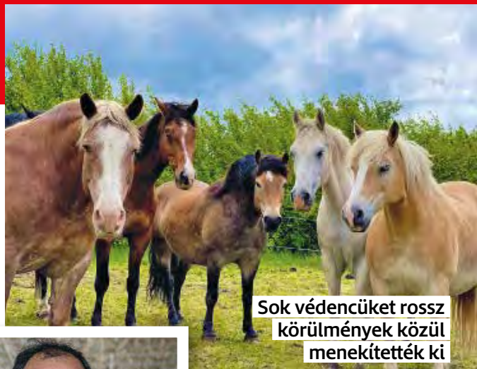
Sok védencüket rossz körülmények közül menekítették ki

A boxok és a karámok közötti ajtókat nem zárják, a lovak saját igényeik szerint jöhetnek-mehetnek az istálló és a hatalmas legelő között – nyáron sokszor az éjszakát is a szabad ég alatt töltik. Ez a szemlélet a Gut Aiderbichl alapelve: az itt élő állatok azt