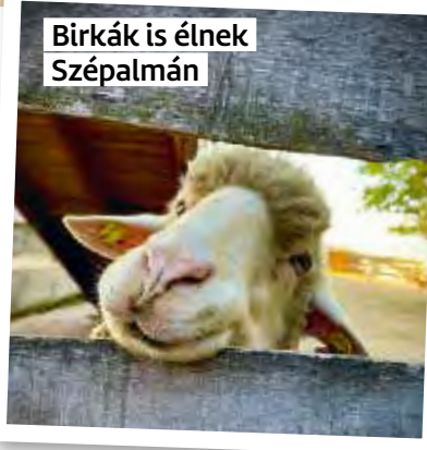
Birkák is élnek Szépalmán

szetvédelmi szemlélet terjesztésében. Michael Aufhauser, aki 2001-ben Salzburgban megalapította a szervezetet, azt vallja: „Ha sikerülne is megóvnunk az állatokat magunktól, az embertől, még nem sok mindent értünk el. Csak akkor lehetünk elégedettek, ha már nincs szükség arra, hogy meg kelljen védeni őket.” Hat országban 30 hasonló birtokot tartanak fenn, amelyeken összesen 6000 állat él: többek közt kutyák, macskák, nyulak, lovak, szarvasmarhák, juhok, malacok, de papagájok, csimpánzok és lámák is.