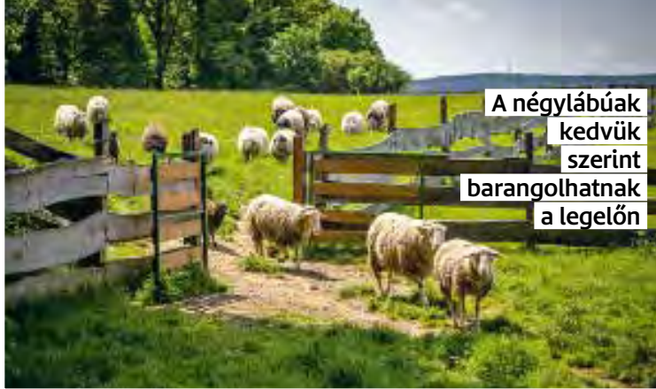
A négylábúak kedvük szerint barangolhatnak a legelőn