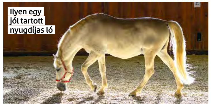
Ilyen egy jól tartott nyugdíjas ló